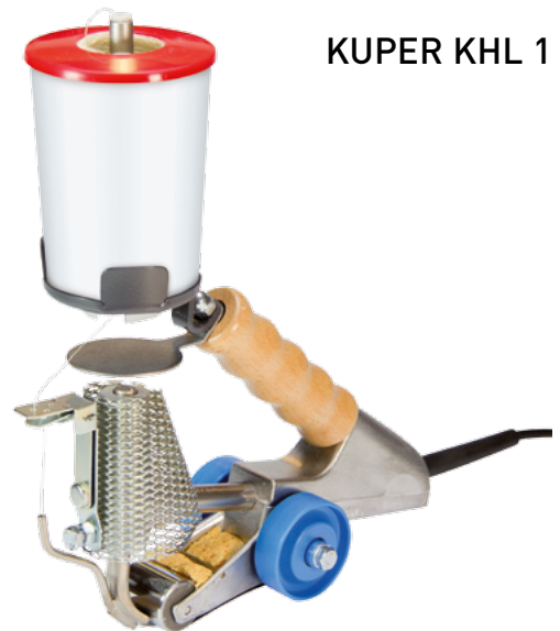
KUPER KHL 1