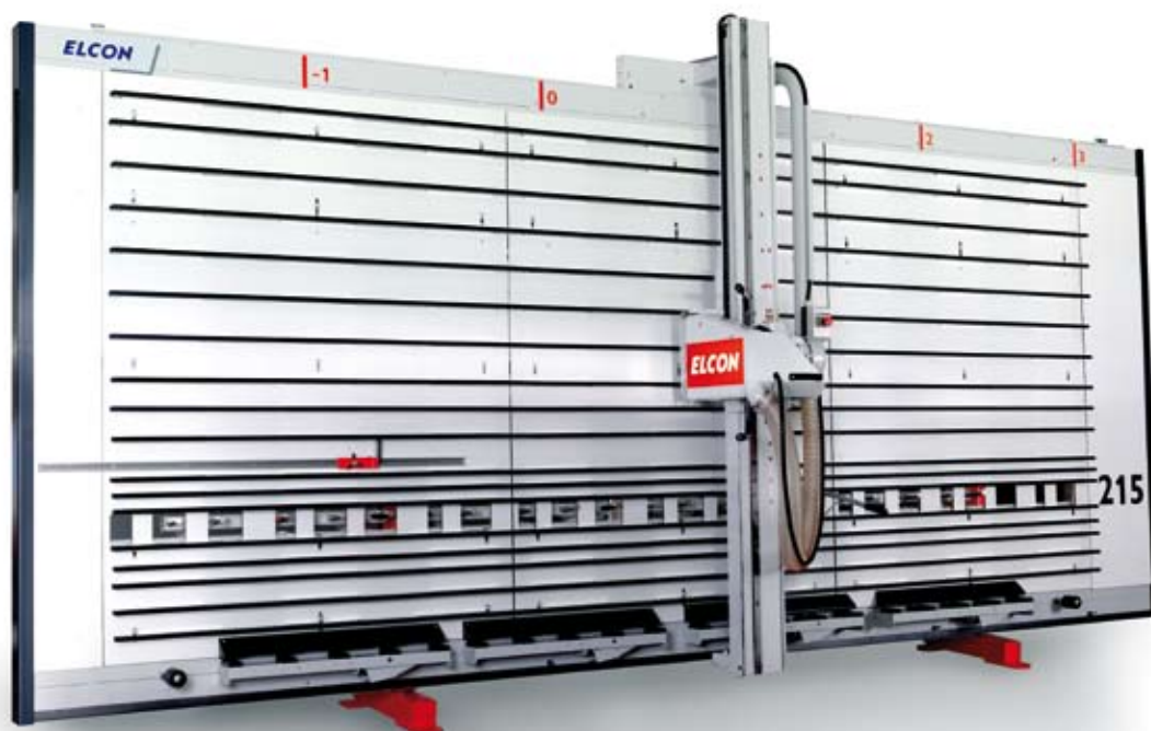
Führung des Sägewagens

Weitere Vorteile der D Baureihe sind die sehr geringe Aufstellfläche und die hohe Austrittstiefe des Sägeblattes von 25 mm hinter der Platte. Dies garantiert ein gutes Schnittbild und eine hohe Standzeit des Sägeblattes.