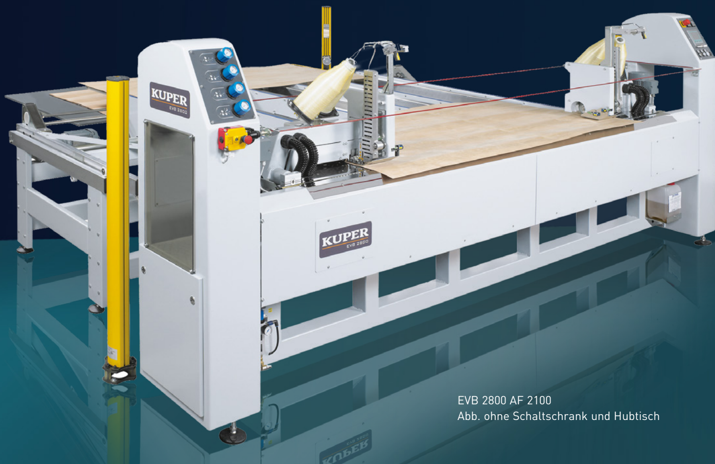
EVB 2800 AF 2100 Abb. ohne Schaltschrank und Hubtisch